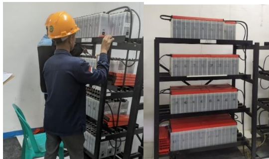
Gambar 3.1 Pemeliharaan baterai

Pemeliharaan baterai pada gambar 3.1 berupa tindakan atau prosedur yang dilakukan secara berkala untuk menjaga kinerja dan umur pakai baterai agar tetap optimal. Pemeliharaan baterai 110 VDC melibatkan sejumlah tahapan berupa pengecekan visual, pengukuran tegangan total, tegangan per sel baterai, pengukuran berat jenis (elektrolit baterai) dan level air.